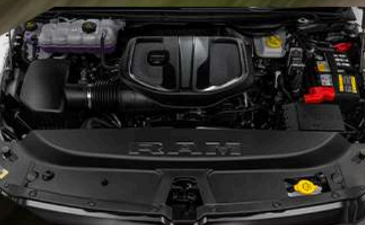
MOTOR 3.0 L TWIN TURBO HURRICANE