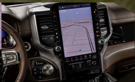
CENTRAL MULTIMEDIA UCONNECT DE 14,5"