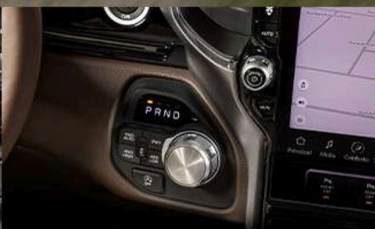
TRANSMISIÓN AUTOMÁTICA DE 8 VELOCIDADES